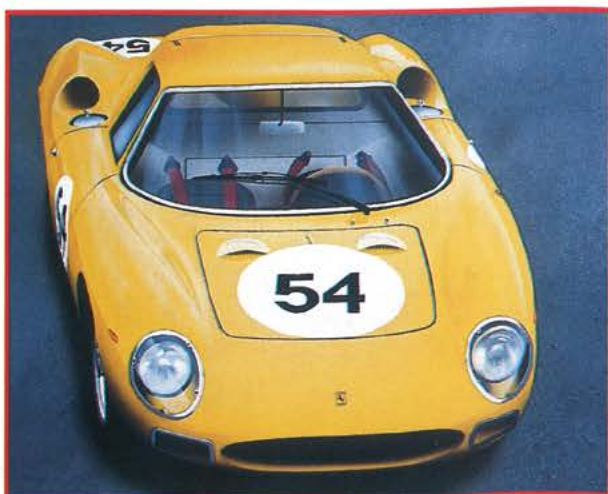
250 LM ▶ Toile 61x46 cm.