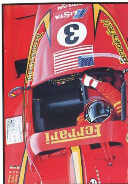
◀ 333 SP. Le Mans 1998 Toile 55x38 cm.