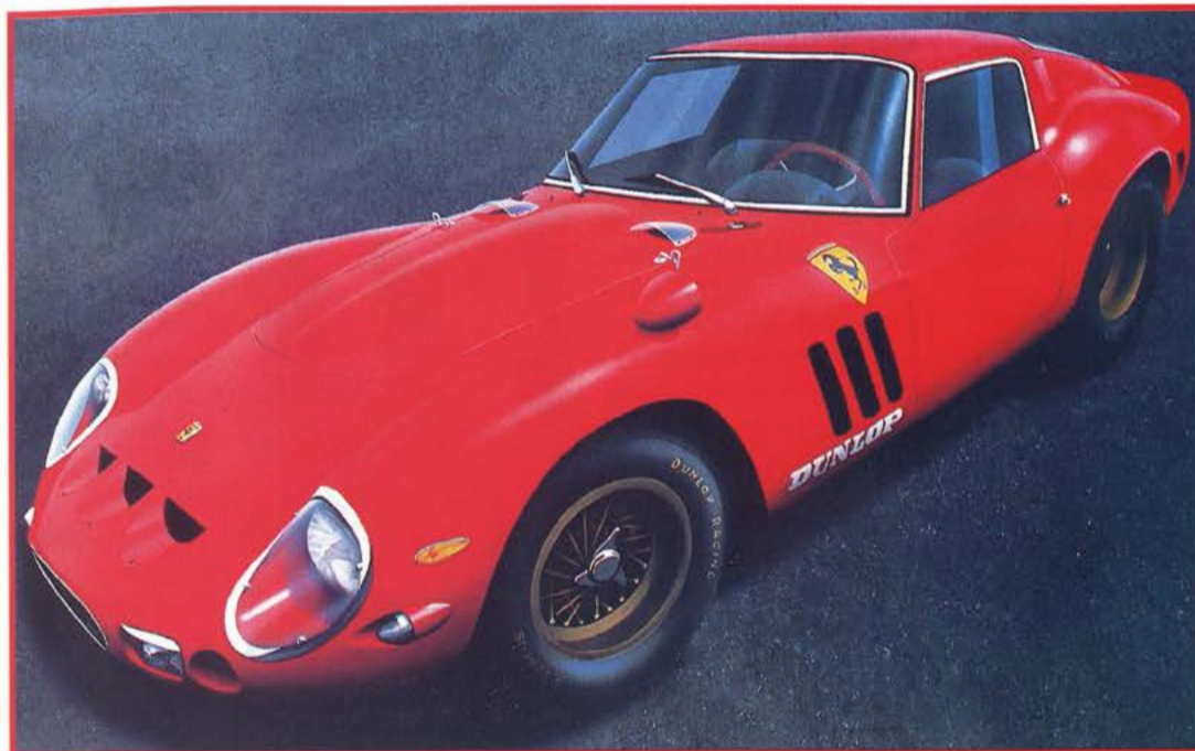
250 GTO ▶ Toile 81x56 cm.